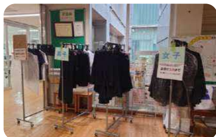
1階中央階段横のスペースに設置した制服リサイクルコーナー

10/25(土)若葉祭当日に、学年委員会の運営にて、制服リサイクルコーナーを開催しました。当日は気温が低く、寒い中での開催となりましたが、たくさんの方にご利用いただくことができました。引き続きリサイクル品の提供も随時受け付けておりますので、PTAニュース最後のページの「制服リサイクル活動」もご覧ください。